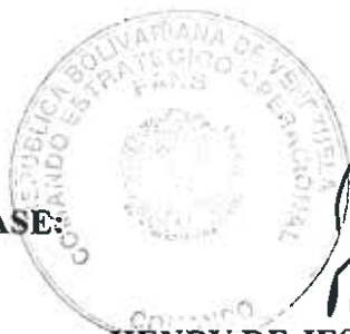
HENRY DE JESÚS RÁNGEL SILVA GENERAL EN JEFE COMANDANTE ESTRATÉGICO OPERACIONAL