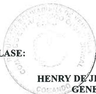
HENRY DE JESUS RÁNGEL SILVA GENERAL EN JEFE COMANDANTE ESTRATÉGICO OPERACIONAL